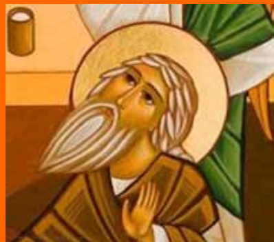
III DOMENICA DI QUARESIMA DI ABRAMO